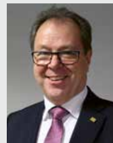
Wolfgang Kramwinkel, Präsident der Arbeitgeberverbände des Hessischen Handwerks