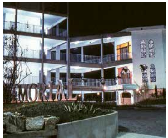
Memorial Necrópole Ecuménica

Aufgrund des tropischen bis subtropischen Klimas in der Region besteht eine Bestattungspflicht innerhalb von 24 Stunden. Außerdem werden traditionelle Friedhöfe aufgrund des hohen Grundwasserspiegels häufig überflutet.