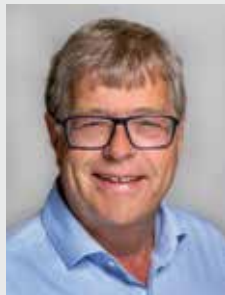
Thomas Radermacher, Präsident des Bundesverbandes Holz und Kunststoff