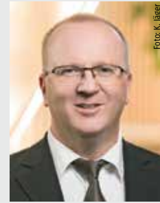
Ralf Gutheil, Bürgermeister der Stadt Bad Wildungen