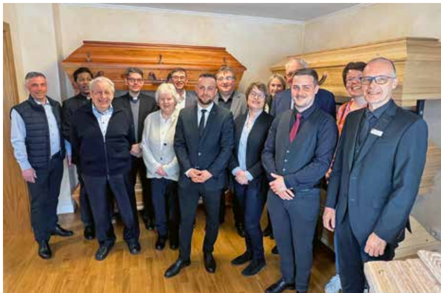
Gäste bei Herbstwind in Eiterfeld