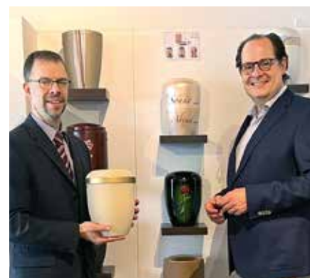
Bei Ortmüller Bestattungen in Wetter

bestehende Unternehmen in der Öffentlichkeit auftritt.