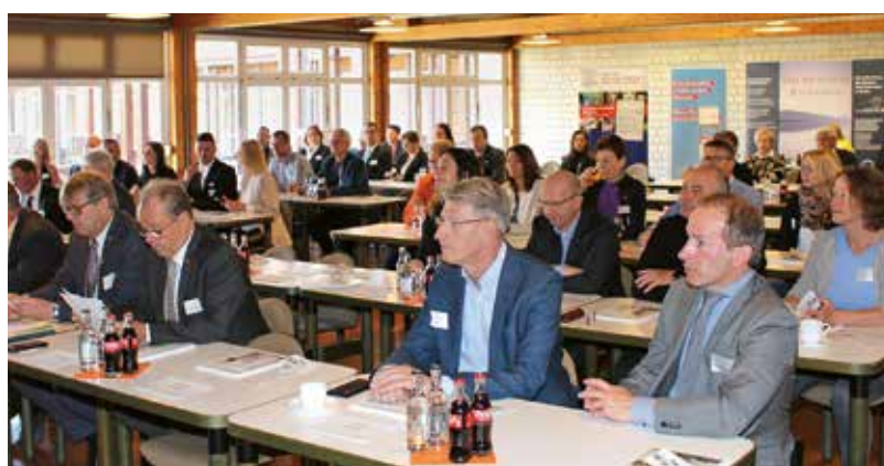
Publikum des 17. Hessischen Bestattertages