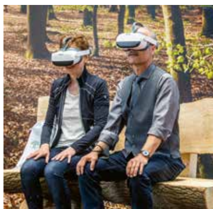
Am FriedWald-Messestand erlebten Besucherinnen und Besucher einen virtuellen Rundgang durch den Wald

Im Fokus stand dabei die Gestaltung von Trauerfeiern im FriedWald, die ihren Anfang am Andachtsplatz im Bestattungswald nehmen können. Bestatterinnen und Bestatter erfuhren, wie der Andachtsplatz für die Trauerfeier dekoriert werden kann, welche Möglichkeiten der Beisetzungsbegleitung es für die Feier unter freiem Himmel gibt und wie Abschiedsrituale im FriedWald aussehen können. Ziel ist es, eine